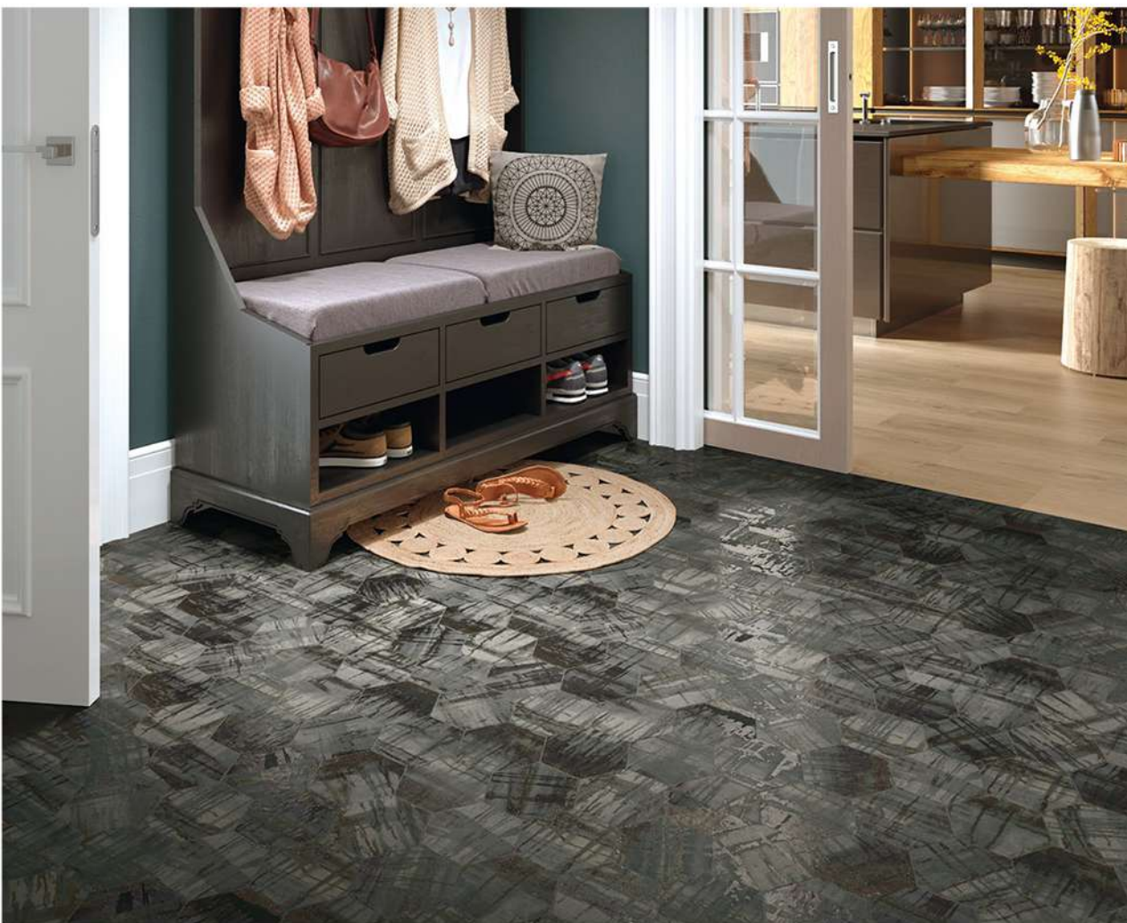
HEXAGON RAKU GRAPHITE 13,9X16 / HAWAII WALNUT 22,5X90

Raku, a recognition of the Asian ceramic legacy.