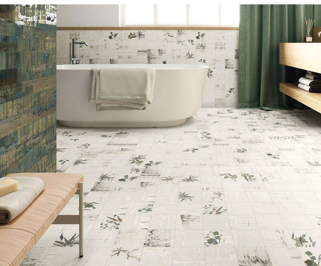
RAKU WHITE 13,8X13,8 / QIN WHITE 13,8X13,8 / RAKU GREEN 7,5X30