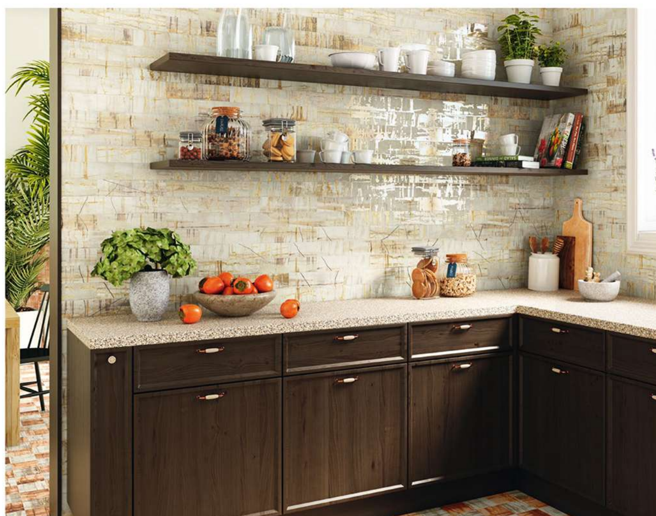
RAKU BONE 7,5X30 / KINTSUGI BONE 7,5X30 / RAKU BONE 13,8X13,8 / RAKU COTTO 13,8X13,8

The collection has three formats, hexagon, brick and square, and six different colors. The great number of possible combinations allow for myriad options of customization. A deeply stirring collection.