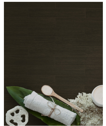
Gran Torino Wenge 6,5x40,2 cm / 2½" x 16"