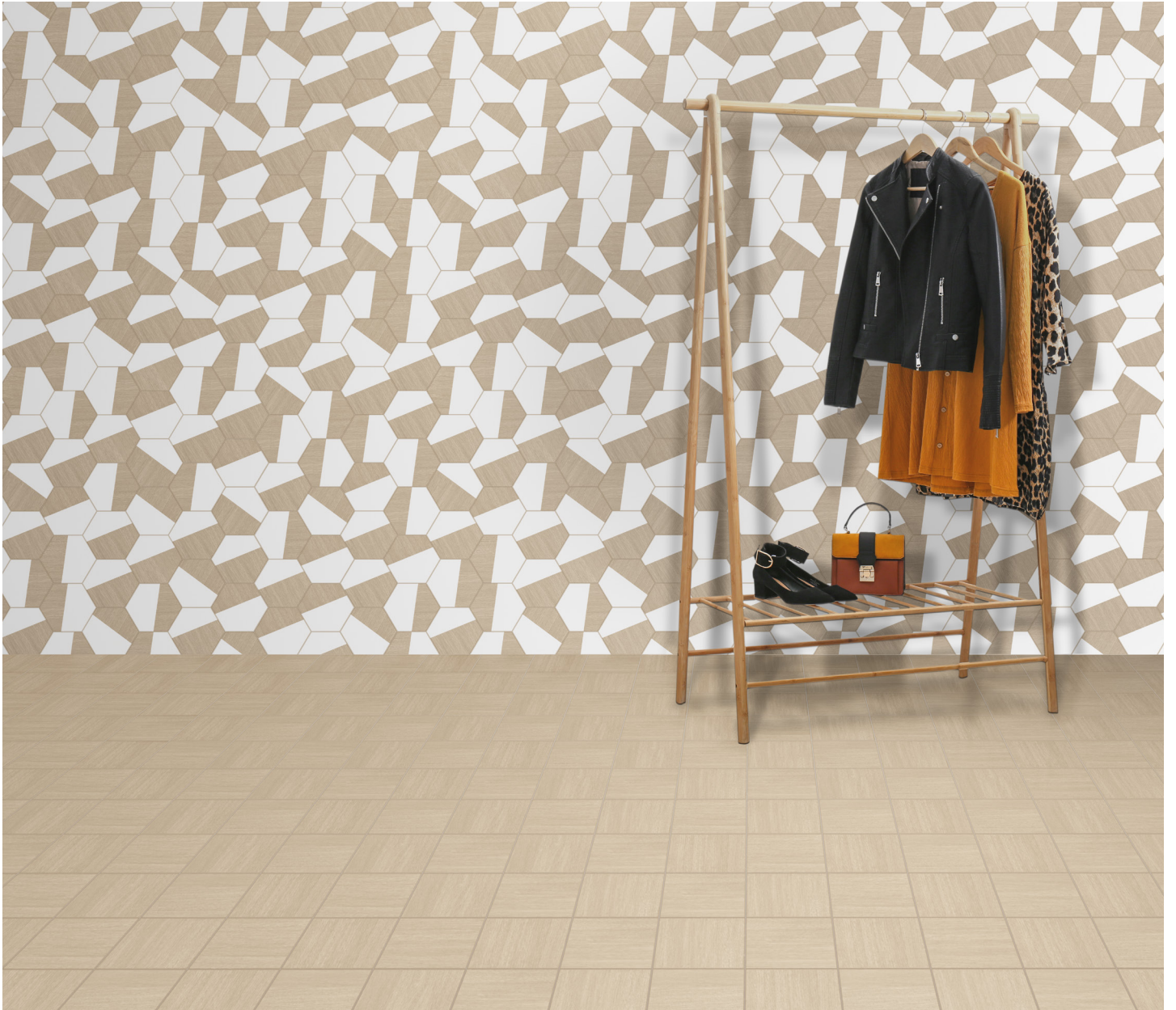
Gran Torino Bianco-Faggio 17,5x20 cm / 7" x 8" Gran Torino Faggio 20x20 cm / 8" x 8"