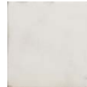
20204 MAISON PLAIN Q-6 (22,3X22,3)