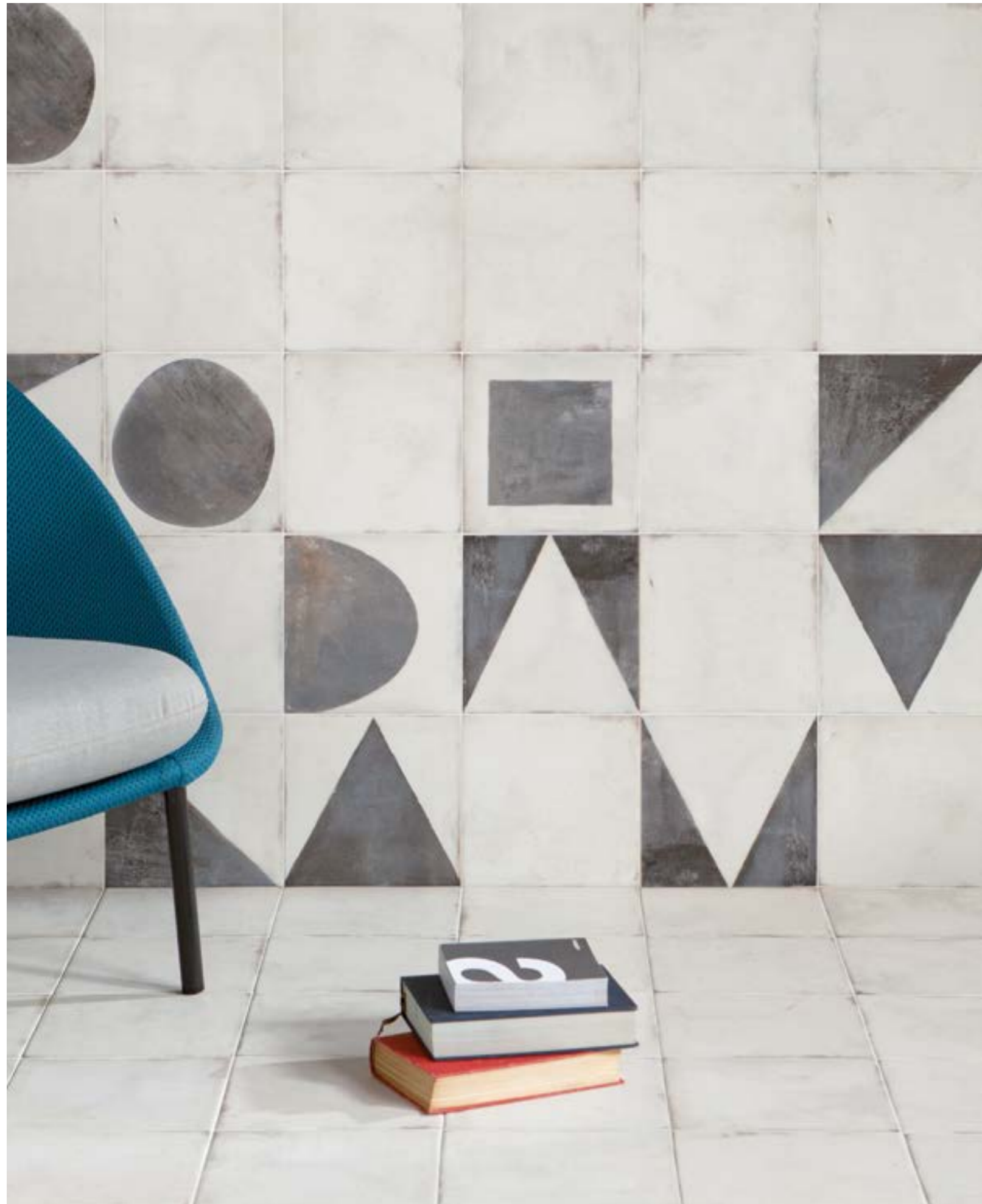
MAISON PLAIN MAISON DECOR