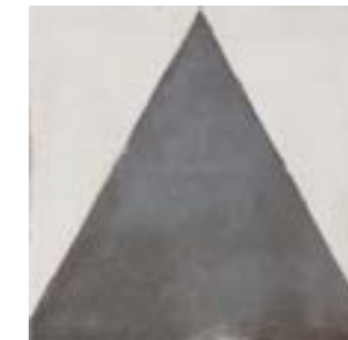
* 20205 MAISON DECOR Q-6 (22,3X22,3)