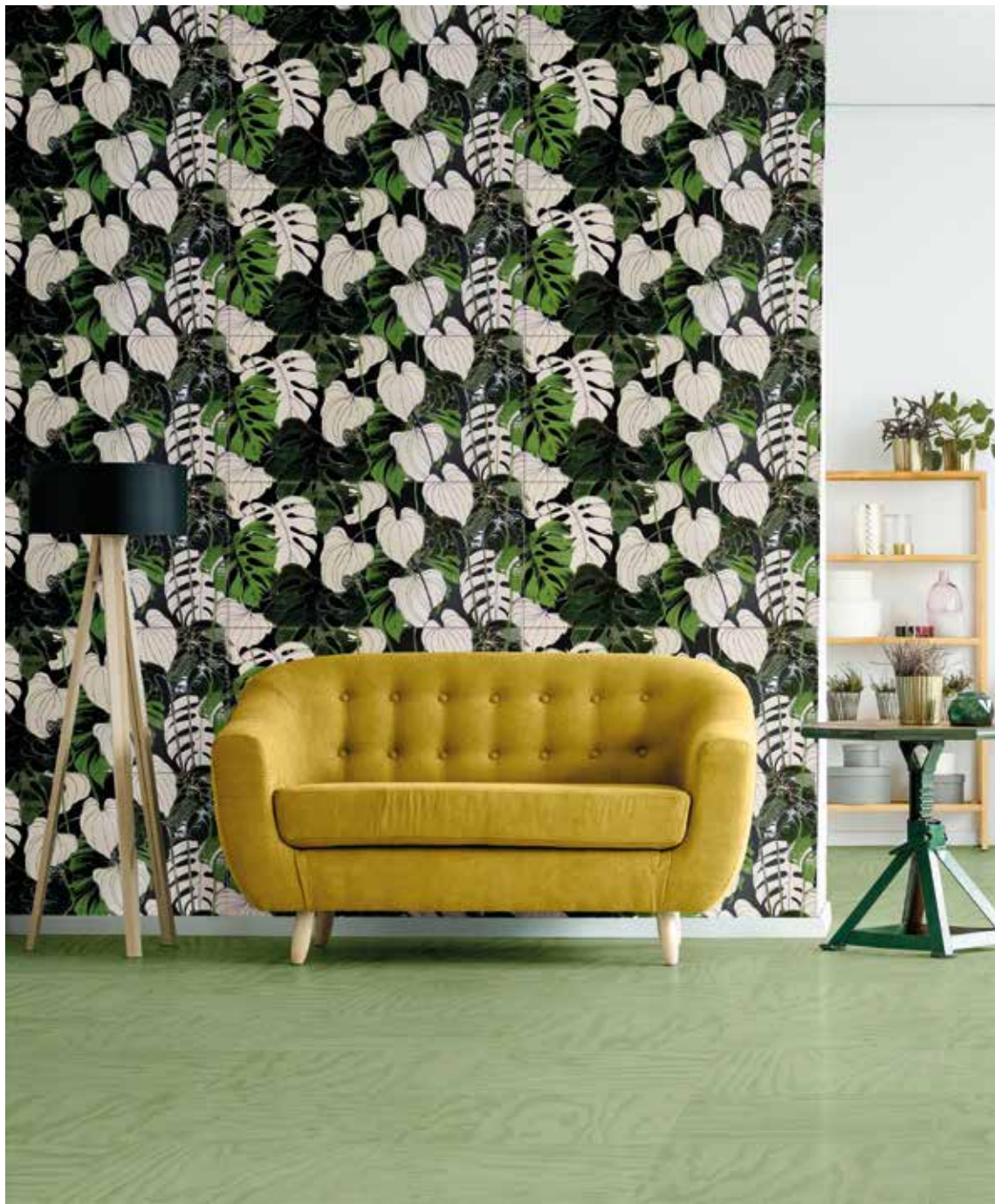
Tahiti Decor 60x120