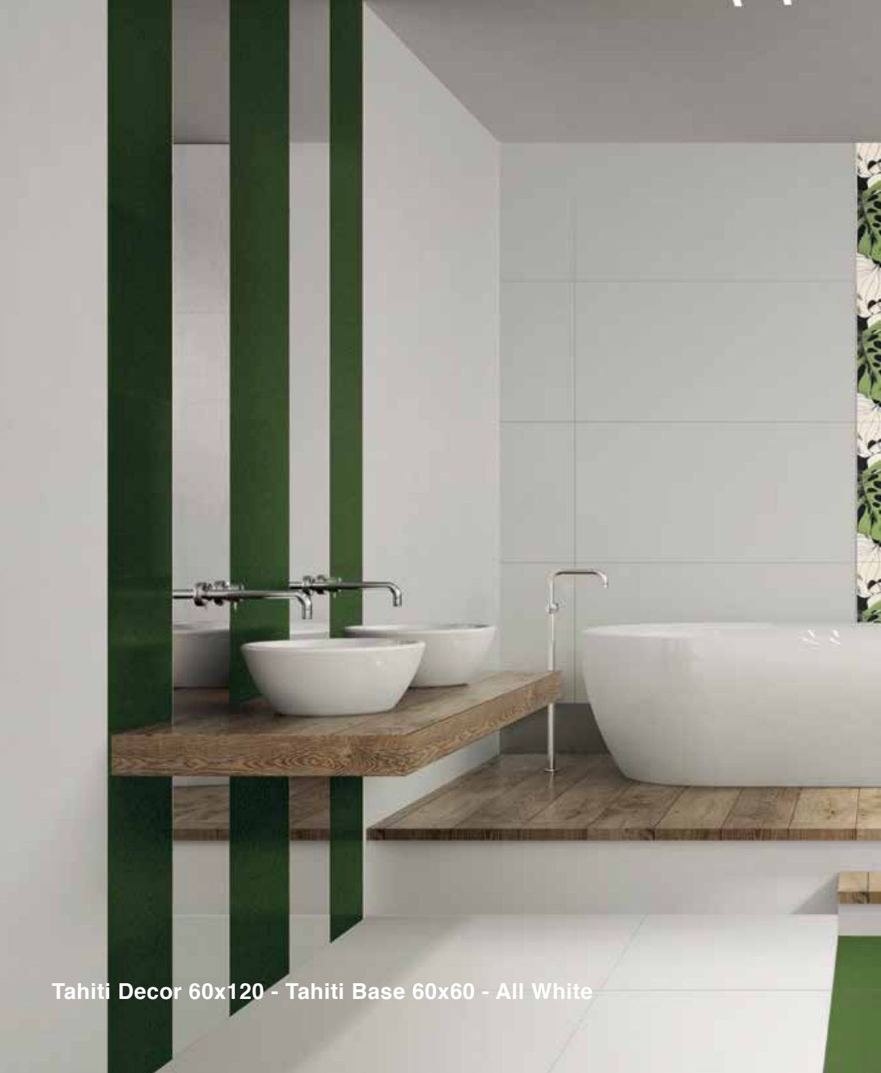
Tahiti Decor 60x120 - Tahiti Base 60x60 - All White