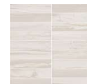
3798 MOSAICO SUMMER