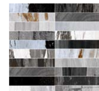
3797 MOSAICO WINTER