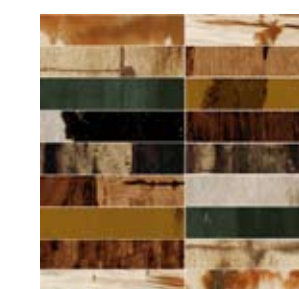
3799 MOSAICO AUTUMN